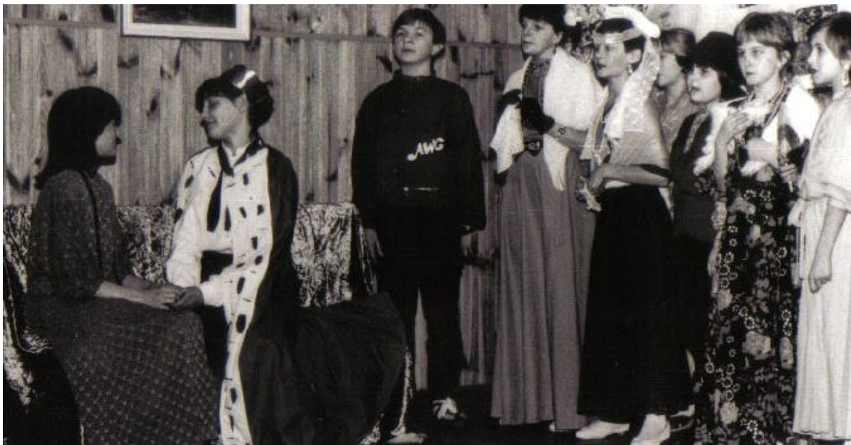
W okresie funkcjonowania szkoły powstał dziecięcy zespół pieśni i tańca, który swoimi występami uświetniał różne uroczystości.