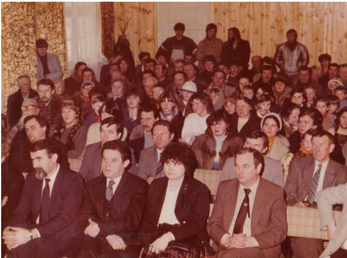
Tradycyjne były jasełka inscenizowane przez lokalną młodzież.