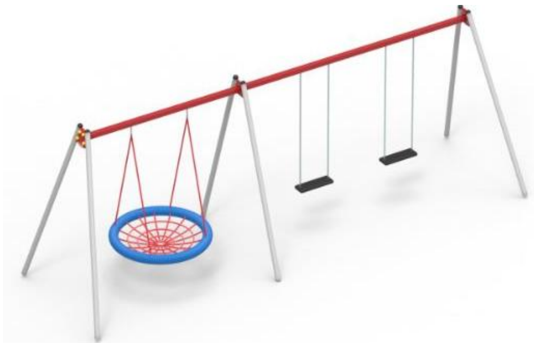
Siedziska huśtawkowe typu koszyk.